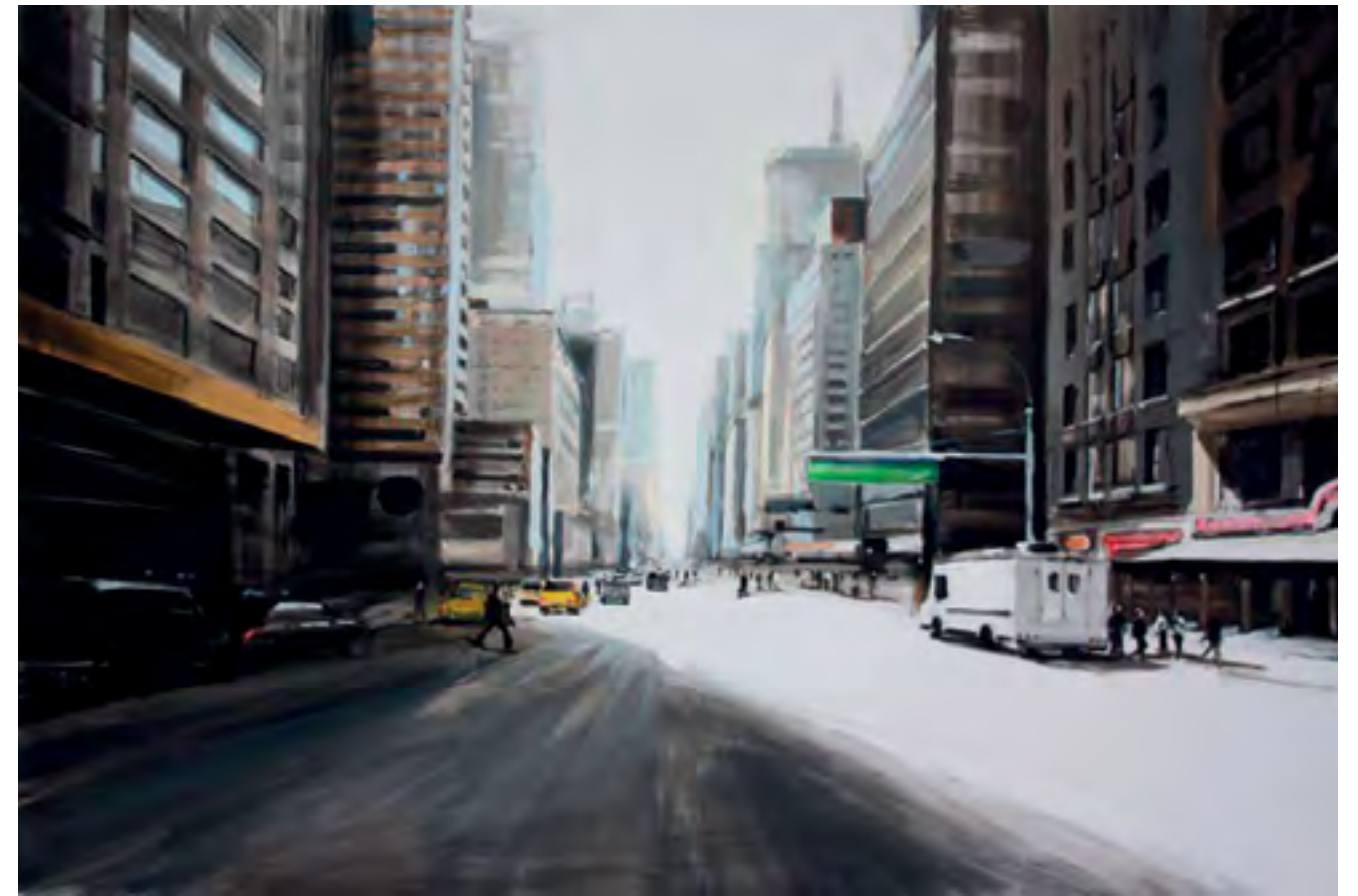
The Road 2015 Acrilico su tela cm 150x100