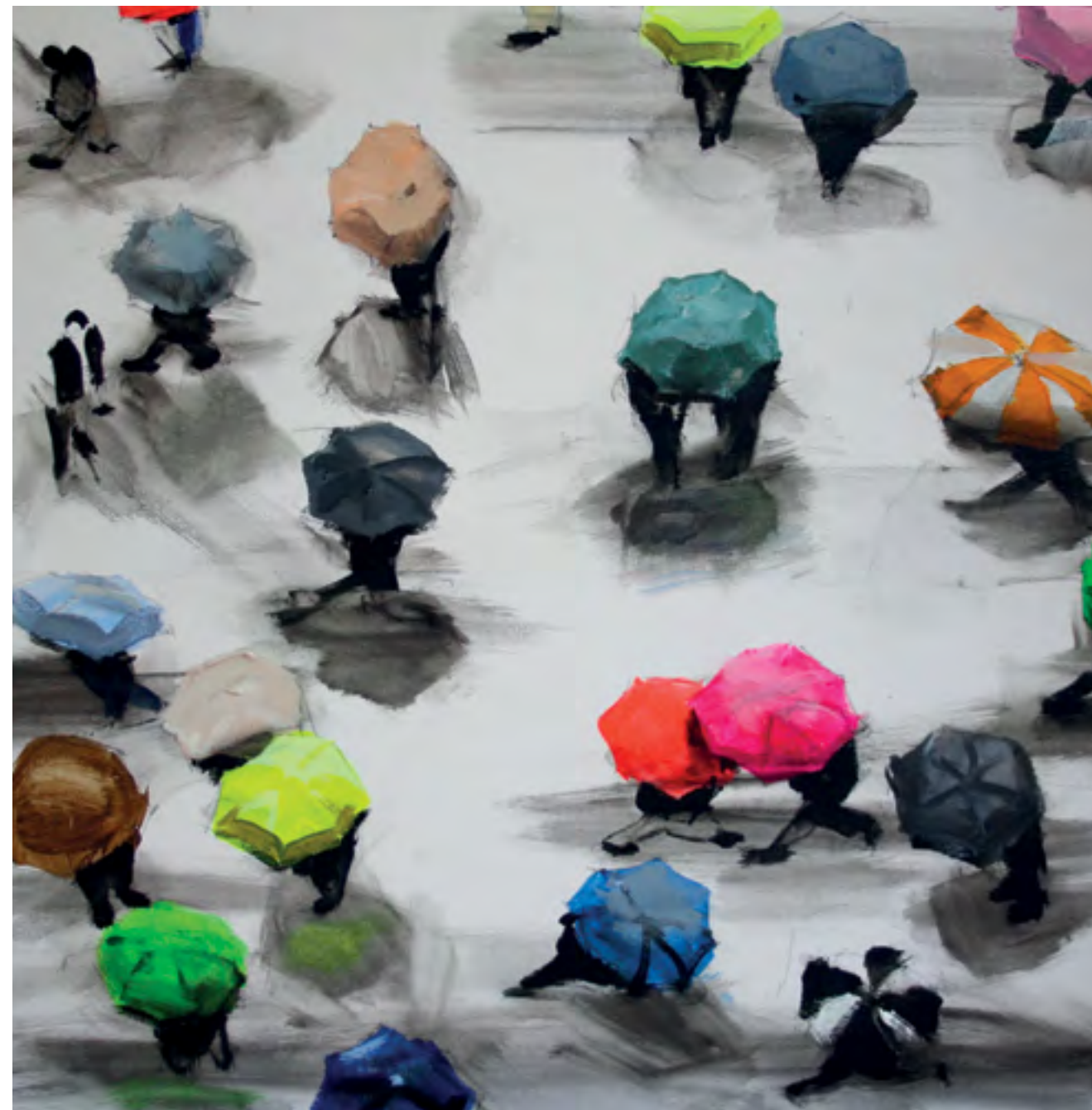
Busy square 2015 Acrilico su tela cm 40x40