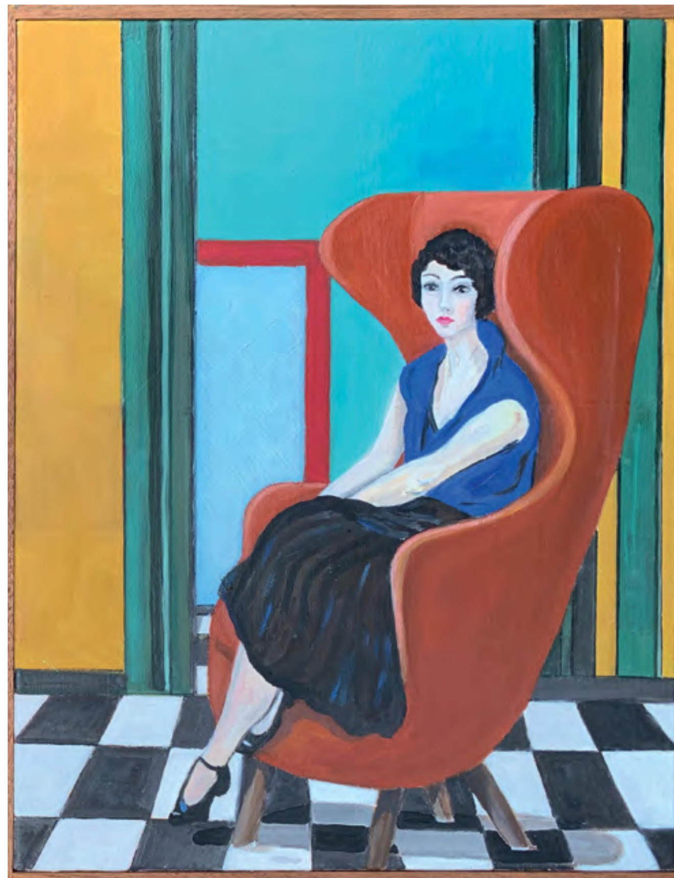
Interno cromatico 2017 olio su tela cm 35x45