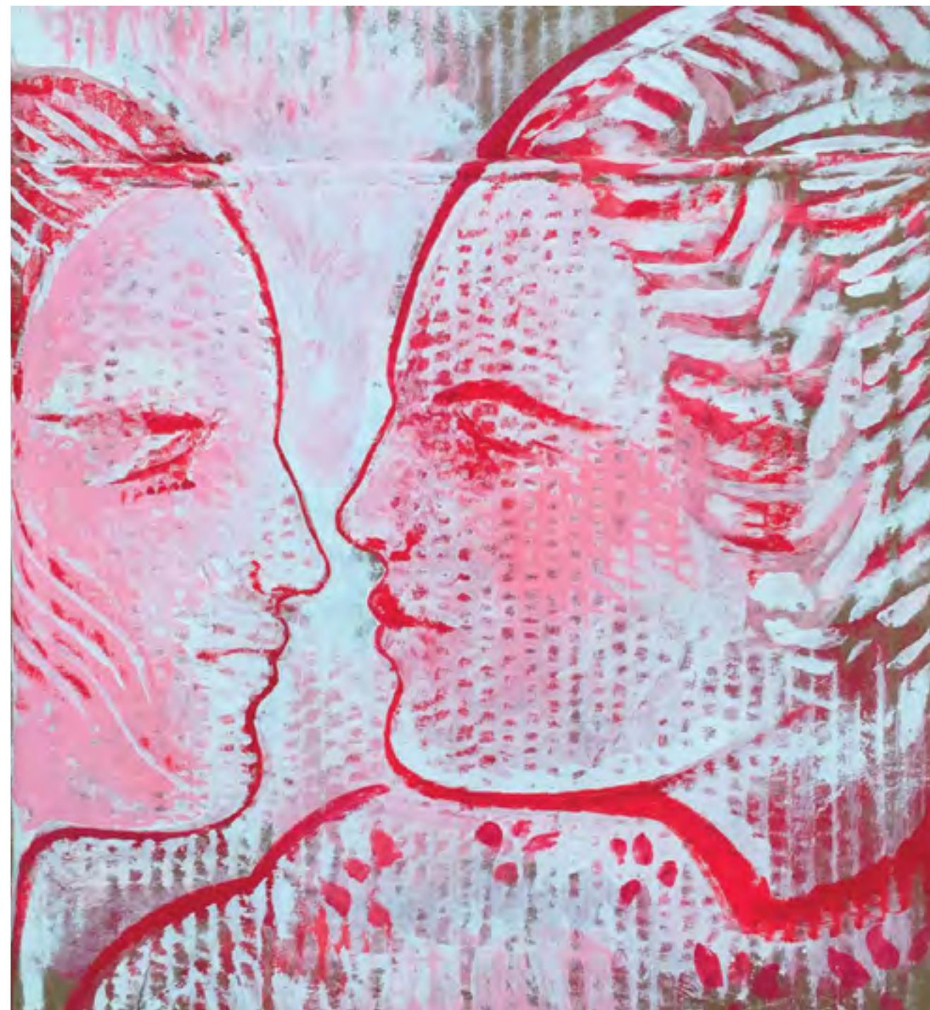
Senza titolo 2019 Acrilico su cartone cm 34x35