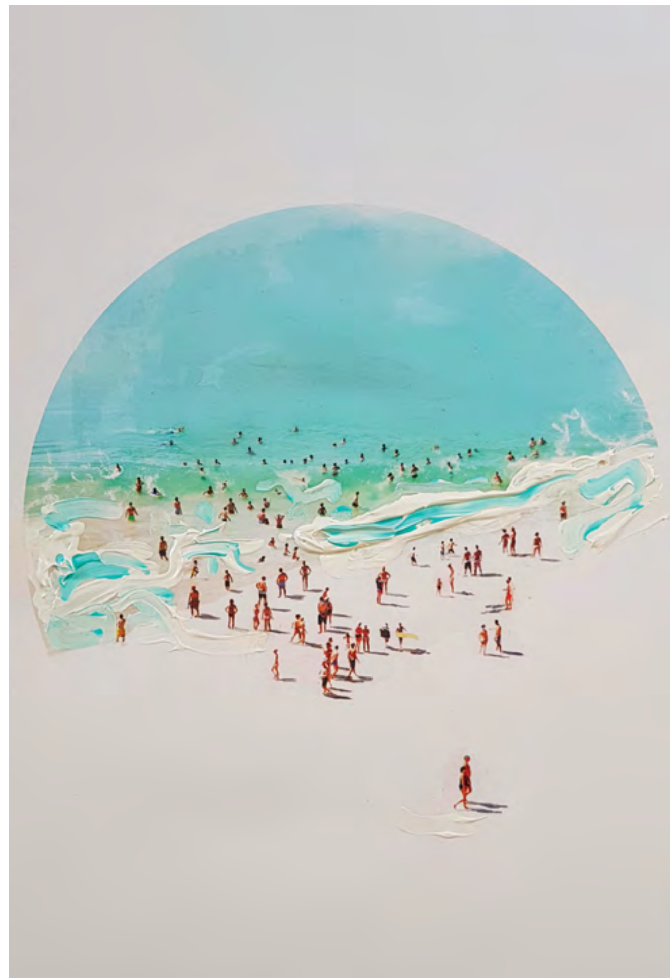
Sunrise 2019 Mixed media cm 40x50

Le pennellate che ci indicano con il loro movimento la direzione del vento. Vogliono raccontarci tanto grazie anche al bianco dominante. Il bianco che ci lascia il giusto spazio per andare altrove, per guardare e per trovarci proprio lì tra i personaggi.