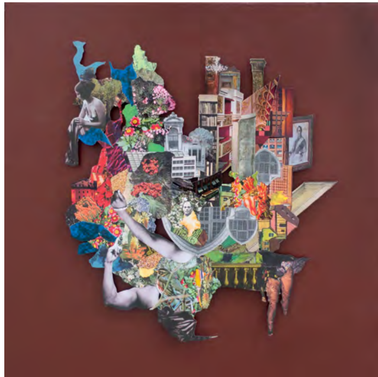
Rorschach _what do you see? #10 2017 Collage in 3D su tela con cornice in plexiglass cm 40x40

"Ho lavorato facendomi condurre dal colore e dalla forma: come per le macchie di Rorschach, altro strumento del mio lavoro di psicologa, propongo una fruizione che va dal globale, dove la forma evoca a ciascuno qualcosa di differente, al particolare, dove una fruizione ravvicinata permette di perdersi nei dettagli delle immagini".