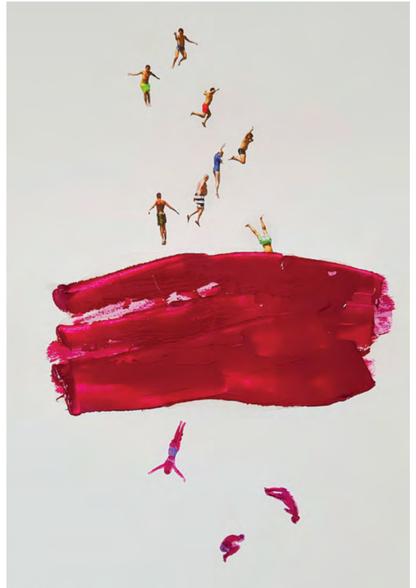
The velvet dream 2019 Mixed media cm 40x50